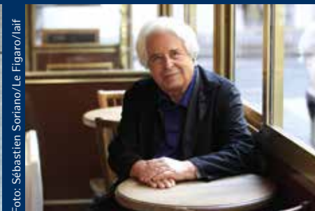
Dr. Saul Friedländer